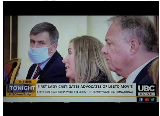
UBC Tonight Uganda - Bezoek First Lady Uganda

Videoverslagen van het bezoek aan de First Lady en President van Uganda 31 maart-1 april