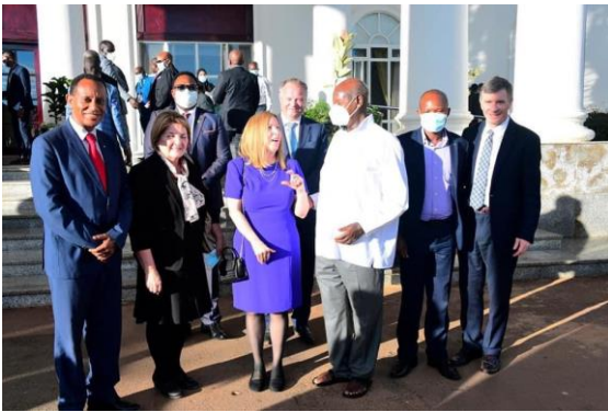
Gesprek met President Museveni van Uganda