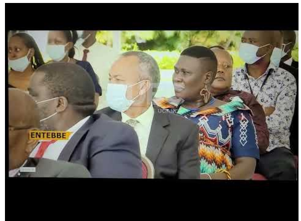
UBC Television Uganda – INTERPARLAMENTAIRE CONFERENTIE VOOR 23 AFRIKAANSE STATEN GEHOUDEN IN ENTEBBE