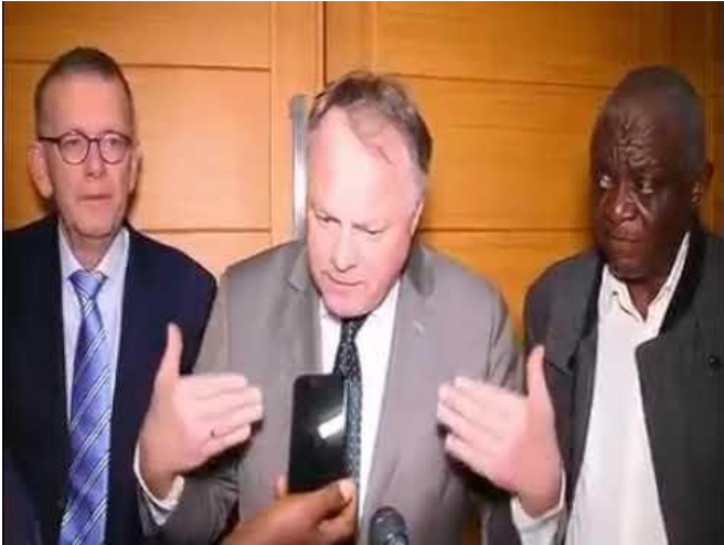
Pers conferentie Congo (video)