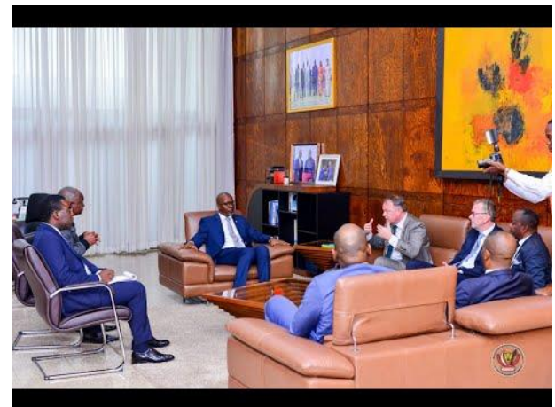
Meeting met de Senaats Vice President DR Congo (De video hierboven heeft geen geluid)

In DR Congo alertheid gewekt over ernstige over het hoofd geziene (morele) problemen in het 20jarig, bindend, nog niet getekende ACS-EU Verdrag, op ministerieel, parlementair en politieke partijniveau en oproep tot actie: Opschoning in Nationale Parlementen. https://deivouseutreaty.org/